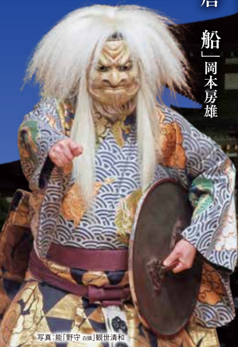
写真:能「野守白頭」観世清和

開演前17時より演目の見どころ解説あり(解説:山階彌右衛門) 日本語・英語字幕解説サービスあり(有料・専用端末貸出先着順)