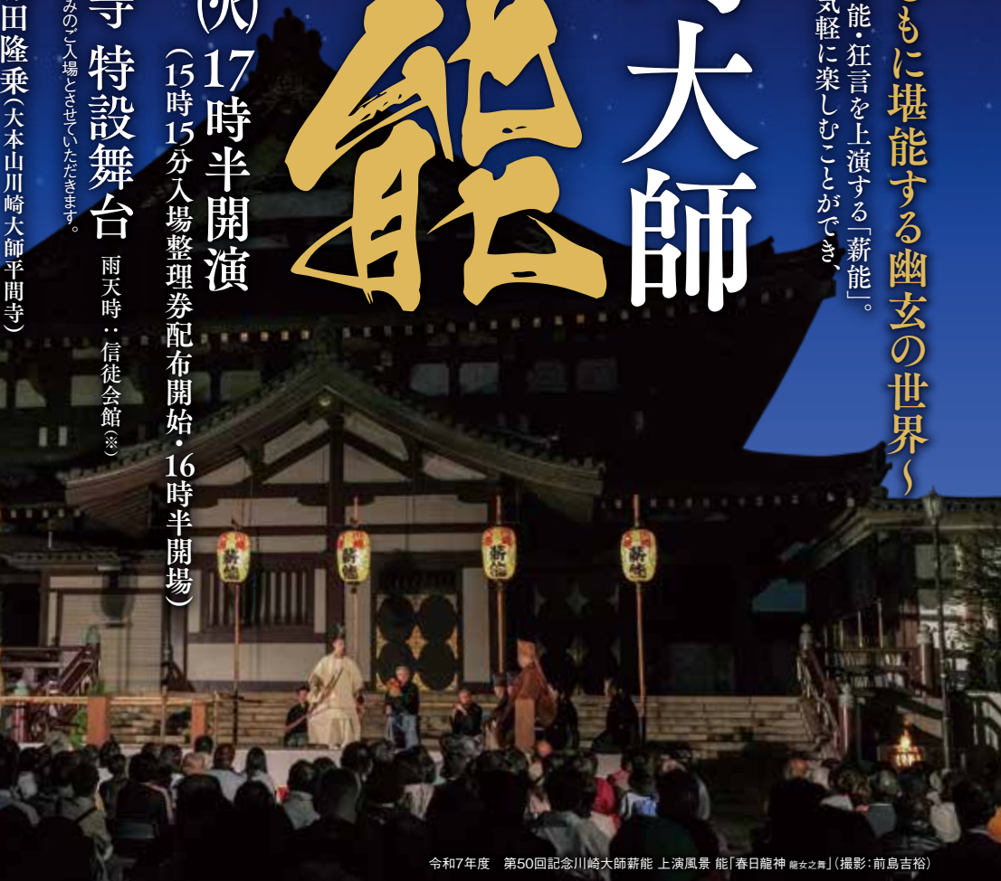
令和7年度 第50回記念川崎大師薪能 上演風景 能「春日龍神 龍女之舞」